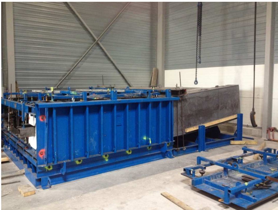
Préfabrication des voussoirs BSI® à joints conjugués