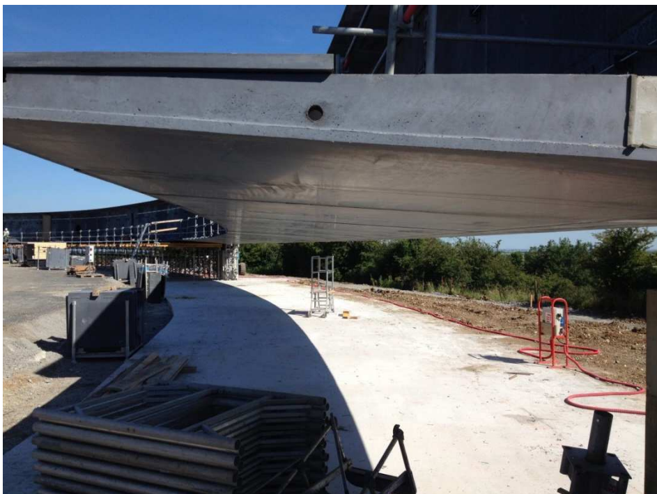
Vue de l'ouvrage en cours de décintrement le 3 Juillet 2014