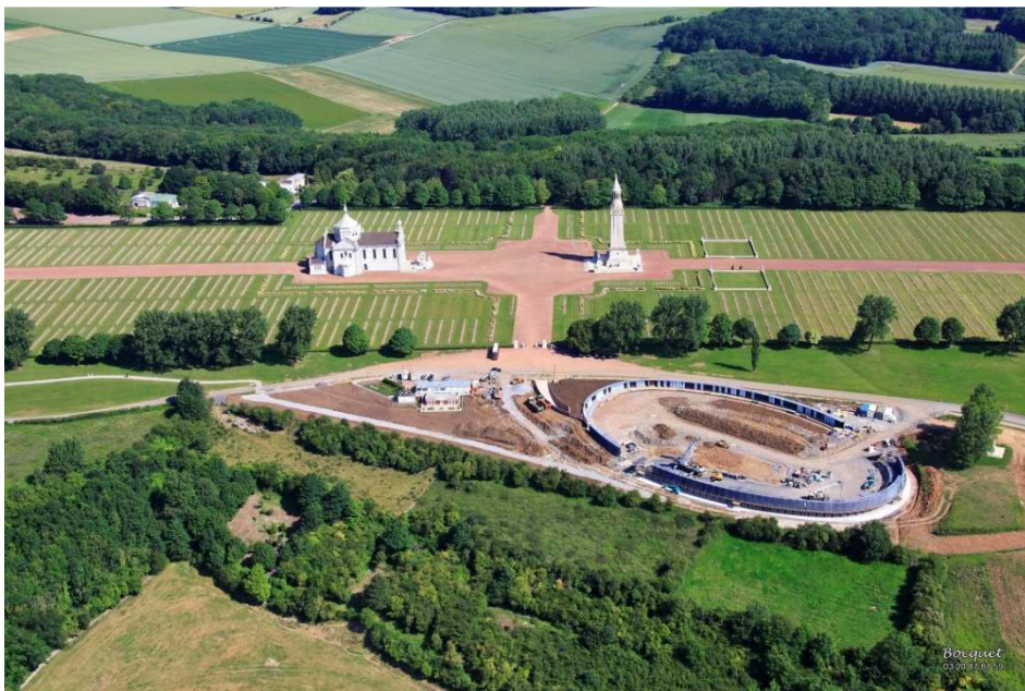
Vue aérienne le 21 Juin 2014

La structure ellipsoïdale est composée d'un anneau d'un périmètre de 345 m. Elle se soulèvera en porte-à-faux sur près de 60 m grâce aux performances du béton fibré à ultra-haute performance (BFUP).