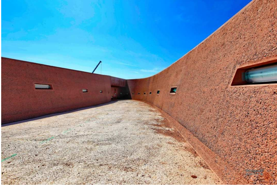
Voiles de soutènement de l'accès au Mémorial

réalisée en voussoirs préfabriqués à joints conjugués ; sa géométrie très particulière, avec des rayons de 101 m et de 27.5 mètres seulement pour des portées de 28, 56 et 37 mètres, conduit à des sollicitations de flexion – torsion peu intuitives ; l'entrée du mémorial a amené à des recherches sur l'emploi de bétons colorés.