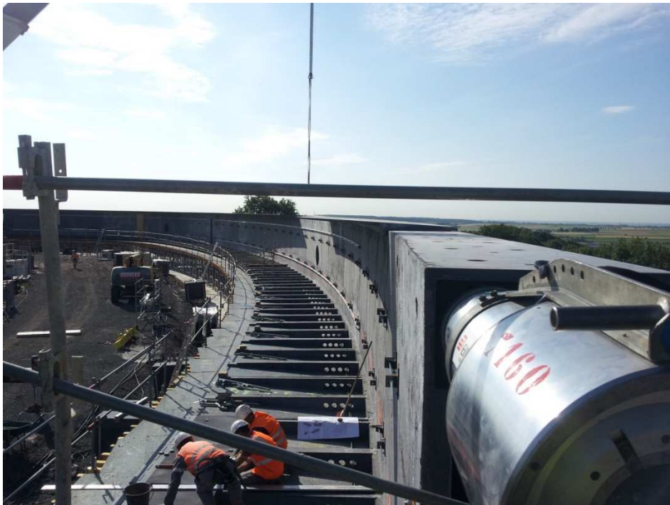
Mise en tension des premiers câbles 19T15S le 1 er juillet 2014