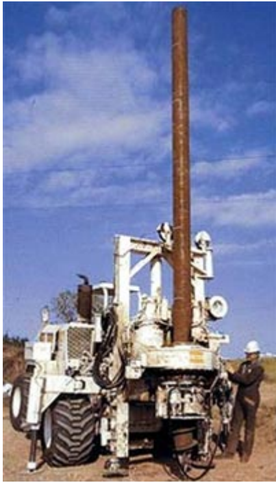
Visseuses Spie

Les pieux vissés sont préfabriqués comme les pieux battus mais au lieu d'être battus, ils sont vissés dans le sol.