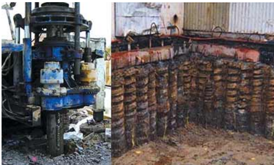
Pieux Atlas