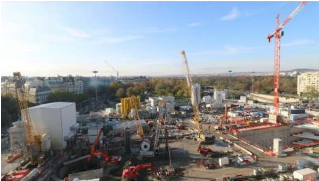
Vue générale du chantier (novembre 2019)

A ce jour, les parois moulées sont achevées. Les terrassements sont en cours. Les travaux de génie civil consistent à réaliser la dalle en béton sur laquelle reposeront les futurs escalators d'accès à la gare.