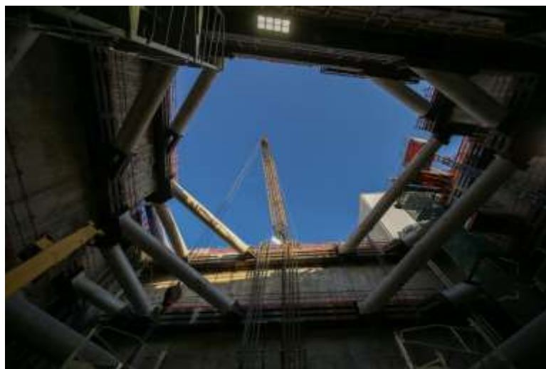
Vue depuis le puits frontal (novembre 2019 – source : direction de projet Eole)