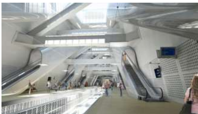
Vue de la future gare depuis les quais

La gare Porte Maillot est donc l'une des trois nouvelles gares du projet Eole. Elle est au cœur d'un vaste projet urbain. Sa construction a débuté depuis 2016 et sa mise en service est prévue en 2022.