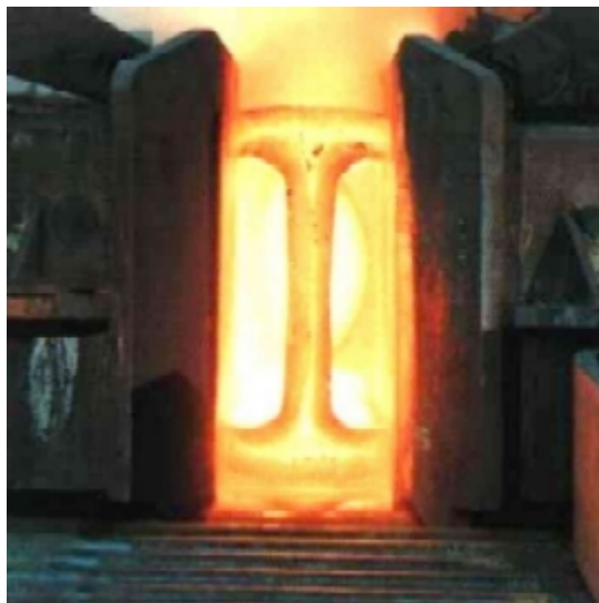
Ebauche de poutrelle laminée (Arcelor long products)

Arrivé à la sortie, il est solidifié à coeur. Il est immédiatement coupé aux longueurs voulues.